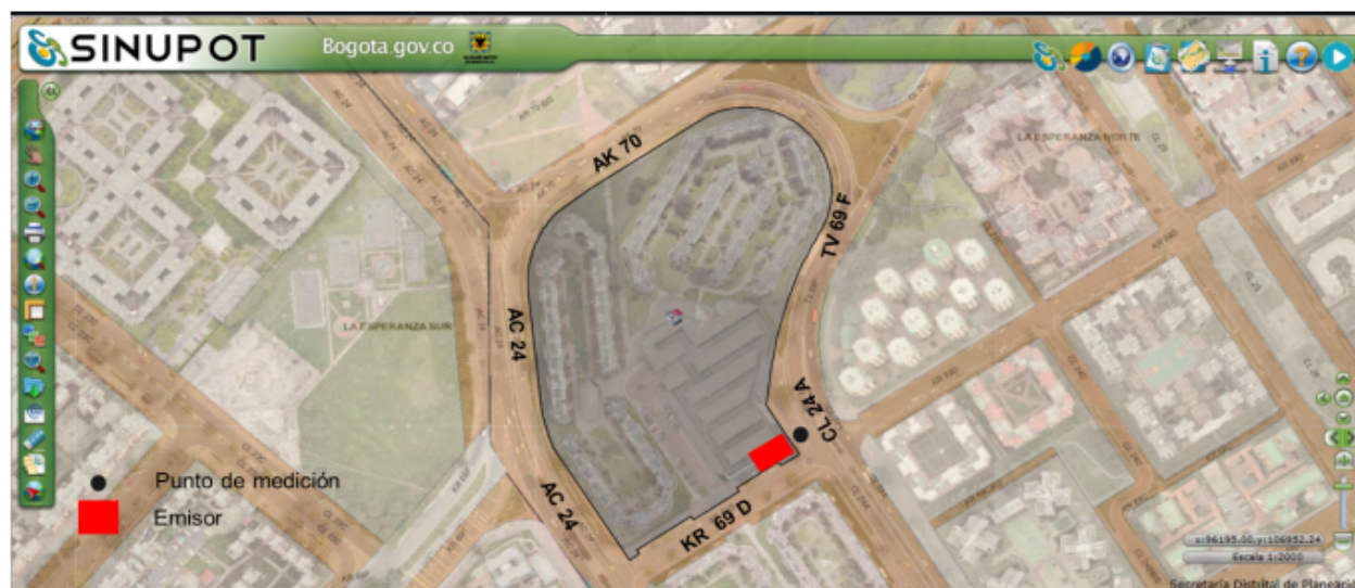
Figura No. 1. Ubicación del predio emisor y punto de medición. Fuente: Secretaría Distrital de Planeación (SDP). SINUPOT